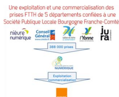
Source : Nièvre Numérique – Projet Nièvre Très Haut Débit - Juillet 2018

En ce qui concerne les infrastructures Très Haut Débit, le FEDER a joué pleinement son rôle de rééquilibrage et de renforcement de la cohésion territoriale même si le cofinancement FEDER reste modeste. En dépit d'une complexité dans le montage des dossiers, il a permis de donner davantage d'ampleur aux projets par une meilleure couverture territoriale. Le FEDER a contribué à crédibiliser les projets auprès des opérateurs et à renforcer la confiance entre les acteurs en matière d'investissement. Il constitue un socle indispensable au déploiement futur des usages que les acteurs sont d'ores et déjà en voie de préparer, ouvrant ainsi de nouvelles perspectives pour le maintien d'activités économiques considérées comme stratégiques dans les territoires les plus isolés.