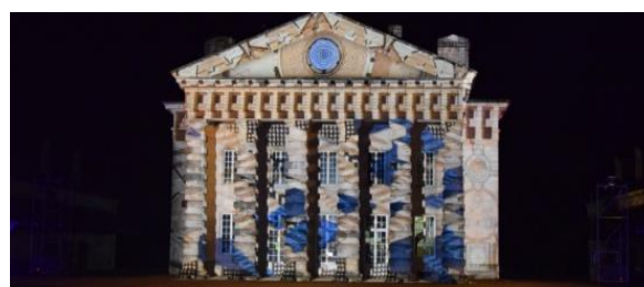
Illustration – Images et Sons Numériques – Crédits : Saline Royale Arc-et-Senans

En dépit d'un faible volume d'actions, les travaux d'évaluation montrent un impact des cofinancements FEDER plus marqué pour les projets de e-tourisme et de e-culture pour plusieurs raisons : ils représentent la moitié des financements et des projets programmés (7 opérations) ; ces filières se trouvent directement concernées par l'évolution des outils/usages et des contenus numériques ; les projets bénéficient d'un taux d'intervention de 60% et les cofinancements peuvent concerner tant de l'investissement que des dépenses de fonctionnement.